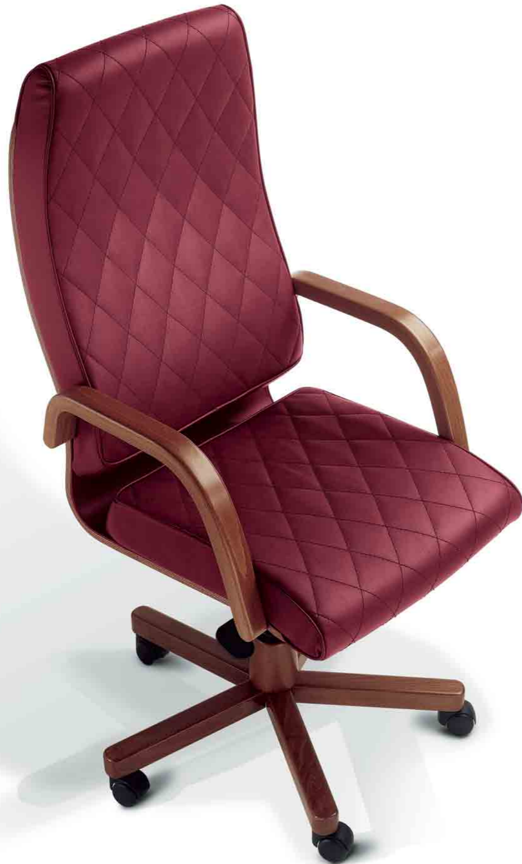
Poltrona presidenziale con braccioli e base in legno. Executive armchair with wooden armrests and base.